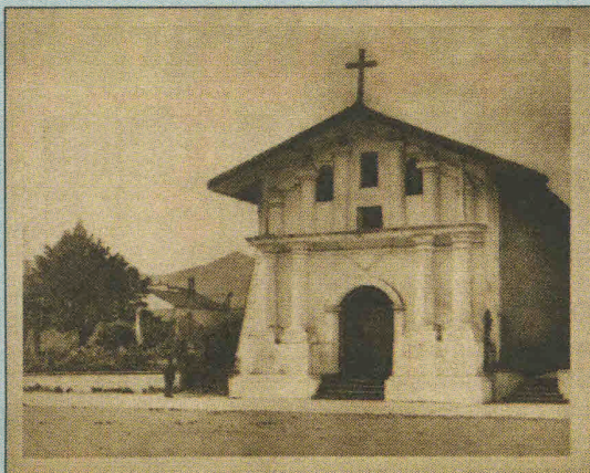
Mission San Francisco de Asís

Designing America , on view from October 20th through April 10th, 2017 is presented in four blocks: The image of America; Constructing the territory; Cities: the Spanish urban space; and Constructed works: architecture and engineering. In each of these blocks, a set of more than 20 maps, images, and objects is matched with parallel narrations that complement and enrich the collection. The visit is completed by The Spanish Language: place names in the United States , an interactive installation that helps to localize the states and cities in the U.S., the video The Spanish Frontier in North America , and a multi-touch table with zoomable maps.